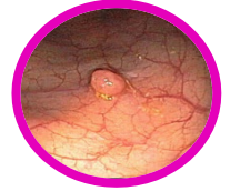
Pólipo en colon